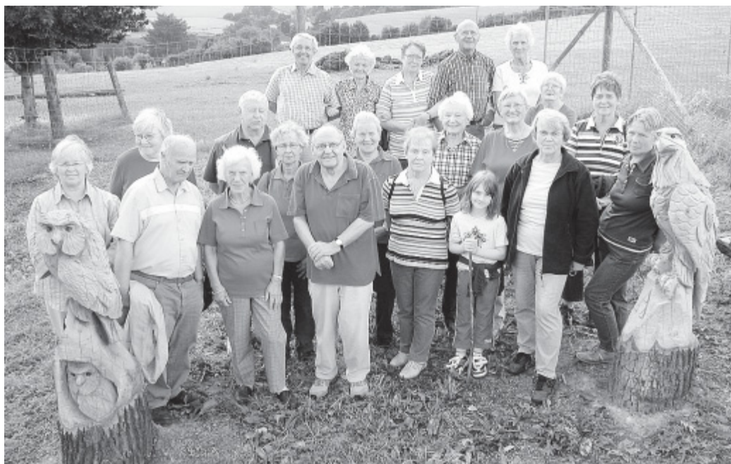
Zwischen Eule und Milan: Die Humfelder bei ihrer Jubiläumswanderung auf dem „Forellenhof“ in Schwelentrup.

Dorfgemeinschaft in 20 Jahren 250 Mal unterwegs